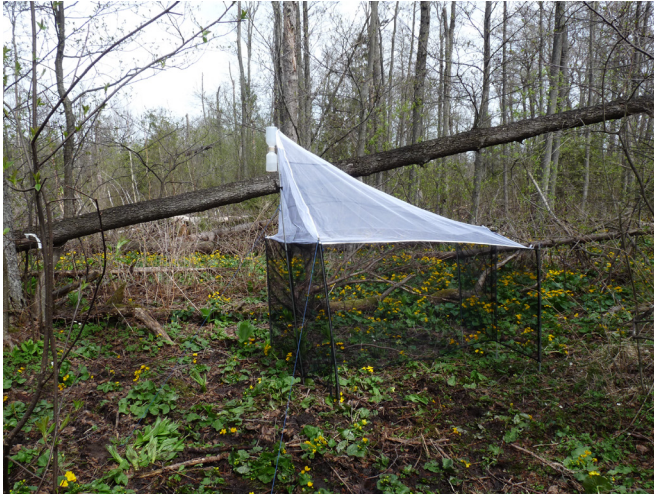
Obrázok 1. Jarný aspekt študijnej plochy Pramenisko a Malaiseho pascou.

Malaiseho pasca je odchyťové zariadenie, ktoré zachytáva letovú aktivitu hmyzu, ale aj pavúkovcov a pod. Pasca je bez vábidla a pracuje automaticky celý deň a noc. Na ploche boli exponované aj zemné pasce (Fridex), plastové kelímky 0,5 l. Na starých pňoch a boli inštalované octové lapače v podobe plastových fliaš. Založenie pascí 29.4.2013 a ukončenie 19.9.2013. Malaiseho pasca bola zničená, pravdepodobne medveďom.